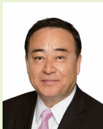
経済産業大臣・衆議院議員 梶山 弘志

昨年来の新型コロナウイルス感染症の影響により、健康面や生活面で影響を受けていらっしゃる方々に心からお見舞い申し上げますとともに、終息に向けて尽力いただいている皆様に感謝を申し上げます。まずはこの未