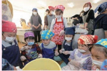
子どもたちと一緒に味噌作り