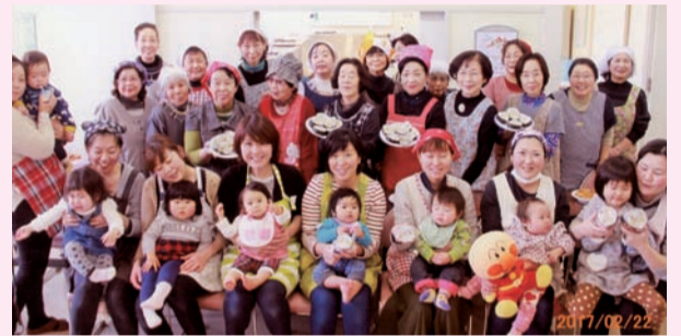
子育て支援「料理教室」