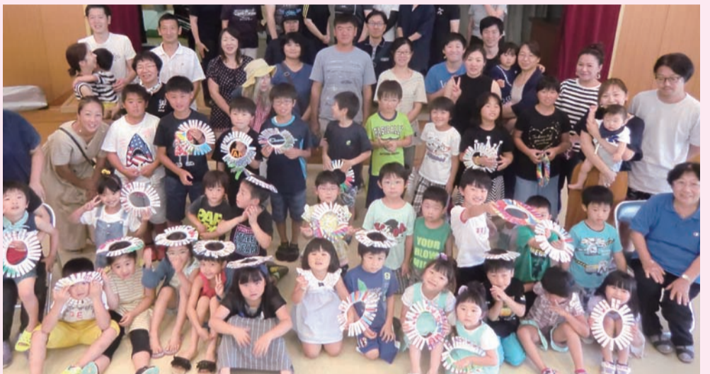
「ムカデ」かんむり作り