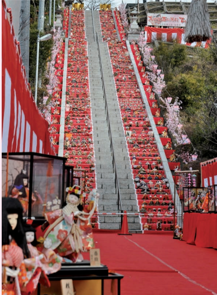
大子の百段ひな飾り