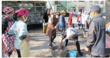
5年生が1年かけて作ったお米の収穫祭。60人もの地域の方が餅つきを手伝ってくれました