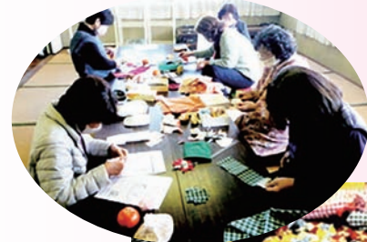
西条市では、気軽に外で遊べない子どもたちのために一つ一つ手縫いで250個のお手玉作り