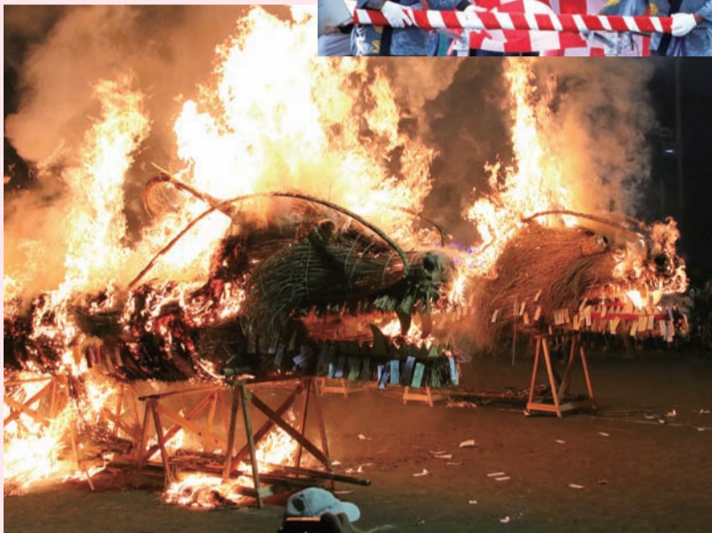
祈願札をつけた龍・昇天、の儀式