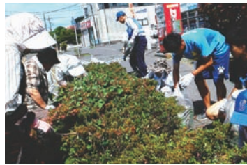
高校生と一緒に清掃活動(秦野市婦人会)