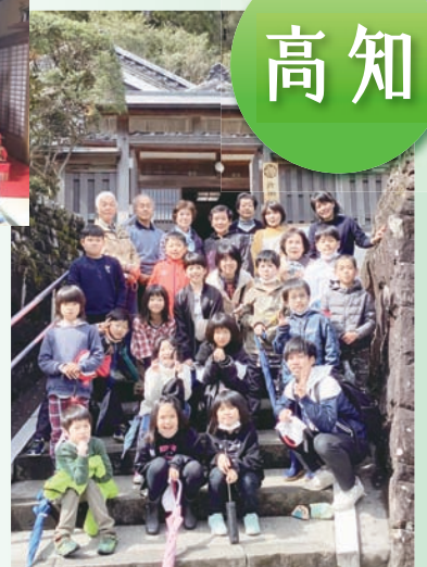
現大阪ガス創業者 片岡直温邸別荘(津野町)で世代交流会