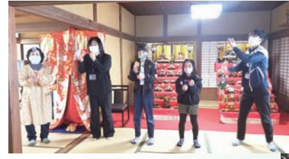
お雛様の前でゲームやあやおり選手権などで仲良く遊び、思い出に残る1日に