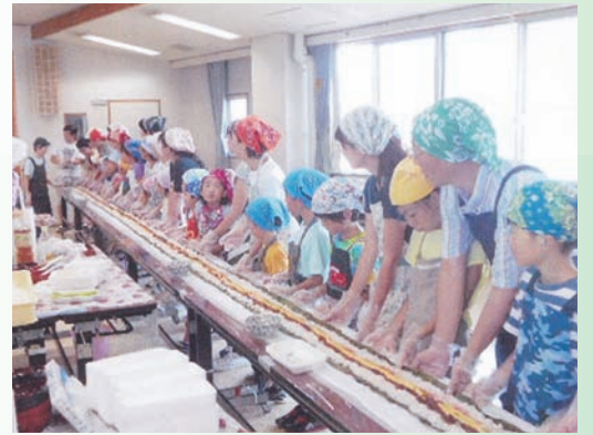
14.4mのながーい太巻き寿司作りに挑戦する小学生