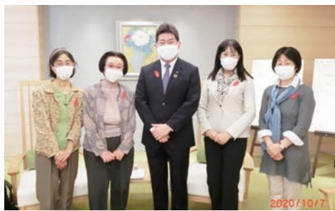
福田川崎市市長訪問。臨海部の工場では産業部門のCO2排出は着実に減少