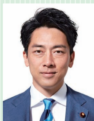
環境大臣 気候変動担当 小泉 進次郎

全地婦連の皆さまにおかれましては、日頃から、マイバッグ運動をはじめ、食ロス、エネルギー問題など様々な環境問題に取り組んでいただき感謝を申し上げます。全地婦連による取組も後押しとなって、富山県ではマイバッグ持参率95%が達成されました。こうした動きを全国に広めていただいていることを