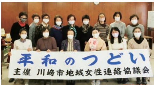
第36回平和のつどいでは、茶道の精神やおもてなしの心を通して平和について考えました