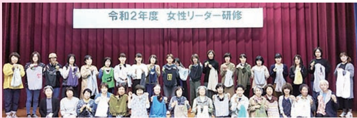
令和2年度 女性リーダー研修

コロナ禍で、模索しながらも現状に合わせた活動を行っています。古着でのエコバッグ作りや、小学校へ手作りお手玉を寄贈するなど、3密を避ける遊びを提案。また、施設のために防護服を200着作って寄贈したり、愛媛発「シトラスリボン運動」に賛同してシンボルリボンを作ったり、地域の笑顔のために頑張っています。