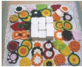
廃食用油で作った石けん(中央)とアクリルたわし