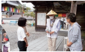
岩本寺(四万十町)でお遍路さんを歓迎。将来は婦人会メンバーに? 子どもたちは私たちにとても宝の存在