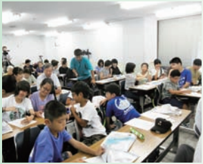
平和の集いでは、戦争、空襲、被爆体験などを次世代の人たちと共に聞き、世代を超えてディスカッション