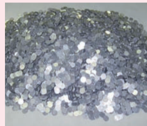
「1円玉募金」地域に役立て