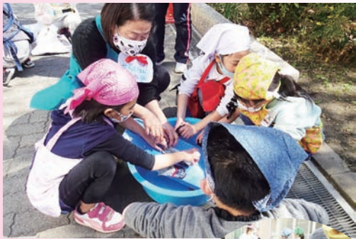
洗濯板を使って、石鹼でゴシゴシ。昔の暮らしを学ぶ子どもたち。石鹼も廃食用油からの手作りです