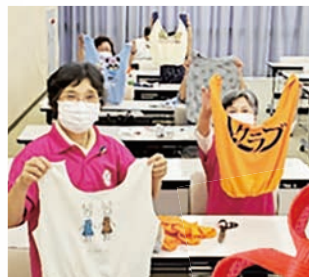
シトラスリボン運動