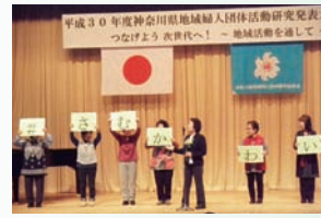
今年で59回目の活動研究発表大会。情報交換と会員の学習の場に