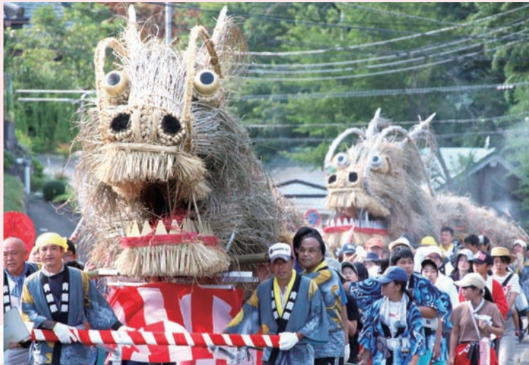
清川村「青龍祭」のパレード