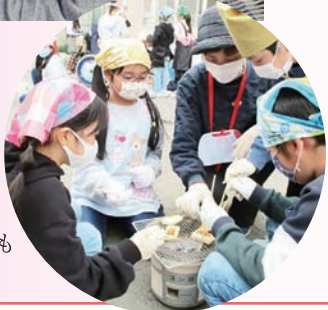
炭火で餅を焼く動作にも子どもたちは興味津々