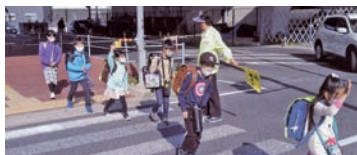
▲子どもは地域の宝物、笑顔で「行ってらっしゃい」「おかえり」