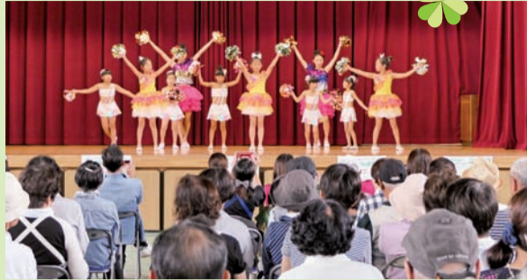
▲名張市小学校にて350名の地域住民が参加しました。