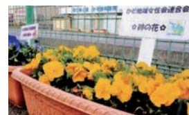
▶加須市内の「花いっぱい活動」

▼「童謡のふる里おおとね道の駅」の花壇管理の活動がスタート、色とりどりの花を植えました。