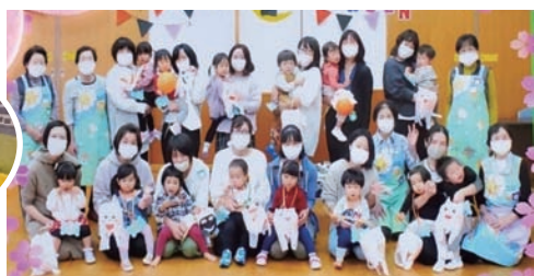
▲子育て支援活動を越谷市地区センター・公民館との共催事業として開催。最終日に笑顔で記念撮影。

◀北本市社協の「おうちdeボランティア第1弾」として手作りマスク150枚を作り、寄付しました。