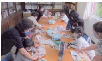
▲備えあれば憂いなし!みんなで防災グッズ作りに挑戦。