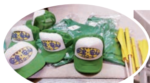
▲小学生の登校見守り隊のユニフォーム

新型コロナウイルス感染症の拡大で、私たち婦人会にも新しい生活様式への移行が求められ、大きな変革の波が押し寄せました。これを前向きに捉え、デジタル機器にチャレンジするおばさん軍団にヘンシン!! 県から郡市に発信、単位団ごとにオンラインの勉強に取り組んでいます。