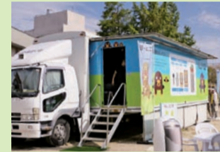
▲左から地震体験ができる起震車、消防車、3Dシアター設備のコミュニケーション車ジオミライ号。