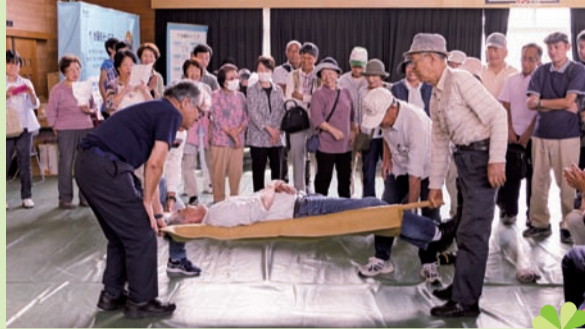
▲三角巾の使い方・人命救助対策訓練。