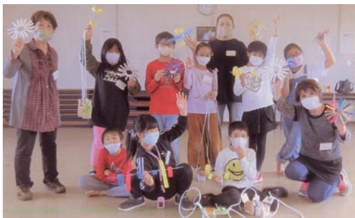
▲公民館に集う子ども達と一緒に「工作で遊ぼう」婦人会員も、はい、ポーズ!

令和2年度、和歌山県婦連も、ほとんどの行事は、縮小や中止せざるを得ませんでしたが、それぞれの地域では、常に笑顔とやさしさを忘れず、つながりを大切に活動を続けています。今秋開かれる「紀の国わかやま文化祭」に、ぜひお越しください。