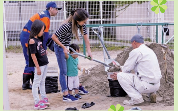
▲親子で力を合わせて土嚢作り。