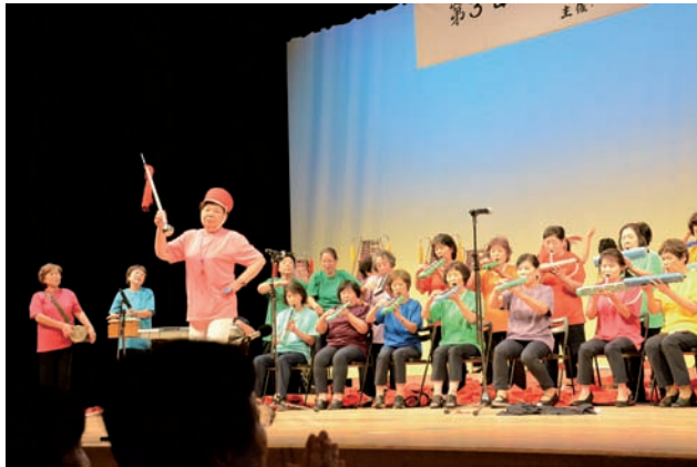
▲観客と出演者の心が豊かになるよう、趣向を凝らした楽しい交流芸術大会。写真は美馬市連合婦人会の鼓笛隊です。

自由で優雅、ダイナミックな踊りは徳島の阿波踊り。しかしそれは生きる苦しさから少しでも明るく豊かに過ごしたいと願う民衆が生み出したものです。今、世界規模の災害や問題等が起きています。私たち婦人会はハートにタッチ、心と心の繋がりを求めて、人々との活動を積み上げていくことから始めています。