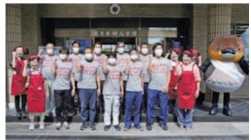
▲訓練を終えて、みんなで「野洲のおっさん」と一緒に記念撮影。