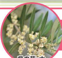
県の花・木 オリーブ