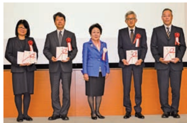
▲1973年から実施の新設小・中・高等学校への緑化寄付活動。2020年度は5校に贈呈しました。当日は4校がご出席されました。

活動がままならない中でも各地域では、マスクや防災ずきん作り、花植え、道路や学校の除草、子育てのお手伝い、学習会など幅広く展開しています。このような時だからこそ、行政や他団体とも強く連携して、活動を広げております。新しい生活様式を取り入れながら、魅力的な地域づくりを実践していきたいと思っています。