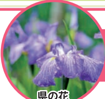
県の花 ハナショウブ