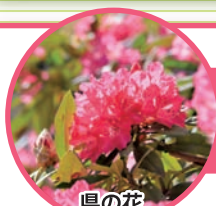
県の花 シャクナゲ