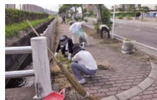
◀7月1日を、琵琶湖条例が制定された日として「琵琶湖の日」と定め、県下一斉清掃に県民みんなが参加して清掃作業をしています。

▼7月18日に「コロナショックから見てきた暮らしの不安、今こそ皆で話し合い政治につなげませんか」と題して、座談会を持ちました。各市町の団体長から困難な状況の中でも工夫しているいろいろな取り組みをされていることに感心し、お互いの励みになりました。