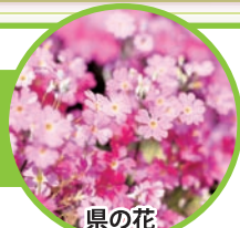
県の花 サクラソウ

◀北本市社協の「おうちdeボランティア第1弾」として手作りマスク150枚を作り、寄付しました。