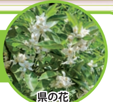
県の花 すだちの花