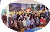
▶GOTOキャンペーンと地域共通クーポン券を利用して、南紀熊野ジオパークで1日研修。