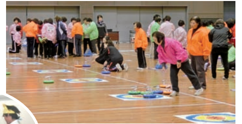
▲白熱戦が繰り広げられるカラーリング大会。