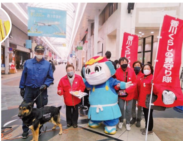
◀くらしの見守り隊と、香川県・香川警察とがキャンペーン。