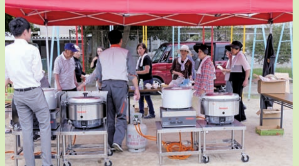
▲昼食のカレーを作る三重女連のメンバー。