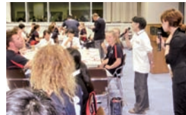
▲オーストラリアの学生と懇親会。渦潮高校の生徒が手作りした、地域特産品を使ったおやつが大好評。