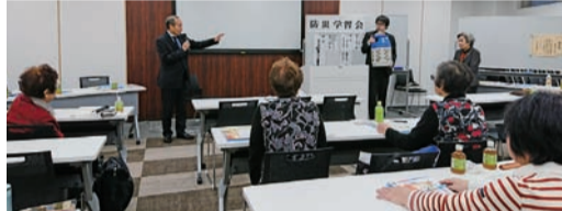
▲2本立ての防災学習会(2019年12月) 「東京都の防災対策～東京マイ・タイムラインで風水害にどう備えるか」に続いて、「もしもに備えるエネルギー、LPガス」の講演を伺いました。