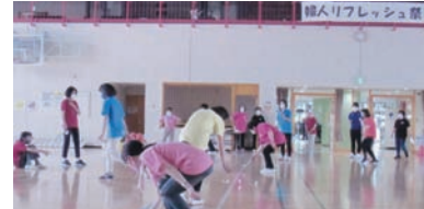
▲裾野市婦人会 婦人スポーツ大会を縮小して“婦人リフレッシュ祭”を開催