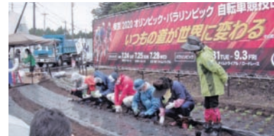
▲小山町連合婦人会 東京2020大会“花のおもてなし”(富士スピードウェイに続く沿道を植栽)

私たちは“次の世代に安心安全を送ろう”をスローガンに、子育て支援・高齢者支援・障がい者支援・講演会・研修会・出前講座・リサイクル活動・視察・啓発啓蒙など地域の皆さんと一緒に活動しています。感染対策を徹底しながら、地域住民とのふれあいを大切に、継続して活動できるよう努力しています。