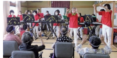
▲NPO法人ふぁみりあネット 地域の高齢者や子ども達と触れ合う訪問演奏活動(アンサンブル演奏)