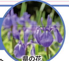
県の花 カキツバタ