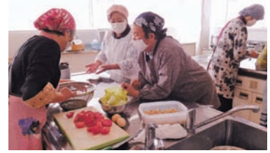
▲伊東市女性連盟 環境問題をテーマに地産地消の料理教室を開催