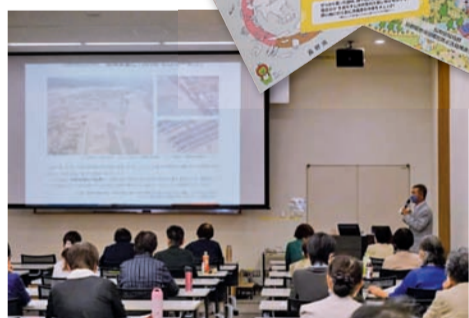
▲ウイミンセミナーながの2021 「はじめませんかエシカル消費」「ゼロカーボンに向けて一人ひとりができること」「フードロス削減について3010」について学びました。

昨年度は、コロナ禍の影響により県全体での事業が中止や延期となりましたが、今年度はまず幹部研修会(ウイミンセミナー)から開催することができました。地球温暖化をテーマに会全体で取り組んでいます。また、それぞれの地域では、コロナ禍でも実践事業(元気やる気、挨拶運動、地域活動など)は引き続き活動しています。