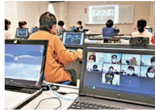
◀Web会議実践のため事前学習。