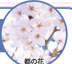
都の花 ソメイヨシノ