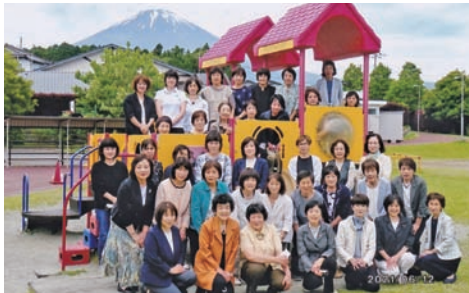
▲御殿場市婦人会連絡協議会 女性の資質向上を目指し“婦人教室”を開催 (エシカル講座後の集合写真)