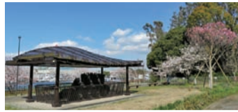
▲都立夢の島公園のエンジンと2本の桜(2020年4月) 東京地婦連の平和運動のシンボル。左は1954年の冷戦のさなかに核実験で被ばくした第五福竜丸のエンジン。右側奥の1本目は2000年に核兵器廃絶を祈念し植樹した「八重紅大島桜」、手前の濃いピンクの桜が東京地婦連70周年記念植樹「サトザクラ」。恒例のお花見のつどいは昨年に続き今年もコロナ禍で中止に。