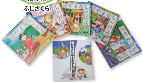
▲ふるさとやまなしの民話集 昭和58年第一集から昭和62年第五集、収録集が平成元年初刊『大地の温もり』が込められた土地の民話。県内各地域婦人会員が、固く結び合いこの地の民話の編集に励みました。私たちの宝物です。