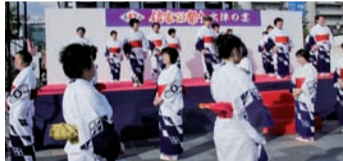
▲信玄公祭り 会員代表50名が、「親しまれ信頼される婦人会」として、おなじみの武田節と風林火山残照を披露致しました。