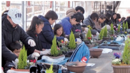
▲体験交流事業 親子ふれあい寄せ植え教室 恩賜林組合の職員の方々の指導を受け、親子で寄せ植えをし植物の相性や育て方を学びました。