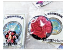
▼参加者に体験してもらうため、あま市七宝焼アートヴィレッジで七宝焼きの学習と実践。