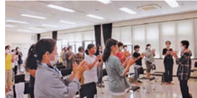
▲地域女性団体きらつといなさ コロナ禍だからこそ“自分の健康は自分で守ろう”と健康講座を開催