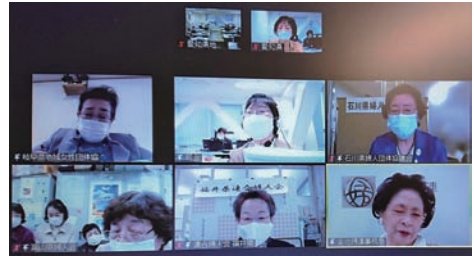
▲5県と全地婦連梗井会長が画面の中で一堂に会した。