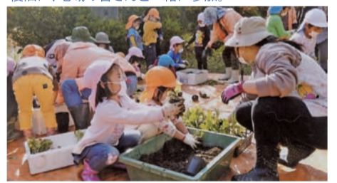
◀信州あいさつ運動 長野県連合婦人会では、独自のタスキを作成し、各地域の婦人会が中学校、小学校、幼稚園、保育園、駅前などであいさつ活動をしています。

▼地域貢献事業 豪雨災害で荒れてしまった花畑の復旧に、地域の皆さんと一緒に参加。