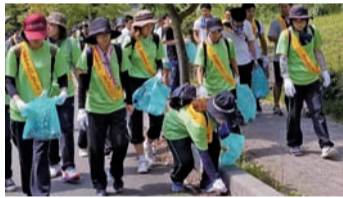
▲富士山をきれいにしましょう 多くの方々とゴミ拾いで清掃活動。