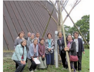
▲展示館の修復を待って記念植樹(2019年) 東京地婦連創立70周年(2018年) 記念「サトザクラ」植樹の前で。背景は第五福竜丸展示館。柱には「第五福竜丸と平和な航海を」と記されています。