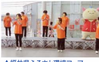
▲福井県ふるさと環境フェア 「わくわくもったいないランド」 福井駅前広場パピテラスにて。