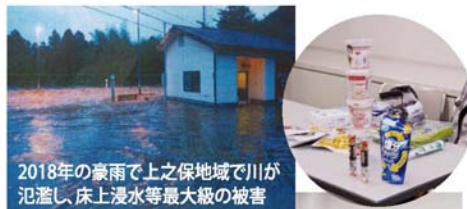
2018年の豪雨で上之保地域で川が氾濫し、床上浸水等最大級の被害

平成12年から「柳津佐波女性の会」が中心となって地域の方々に呼びかけを行い、子どもたちが安心して生活できるよう「柳津町こども見守り会」が発足。現在、子ども見守り活動は、岐阜市の全地域へ広がっています。