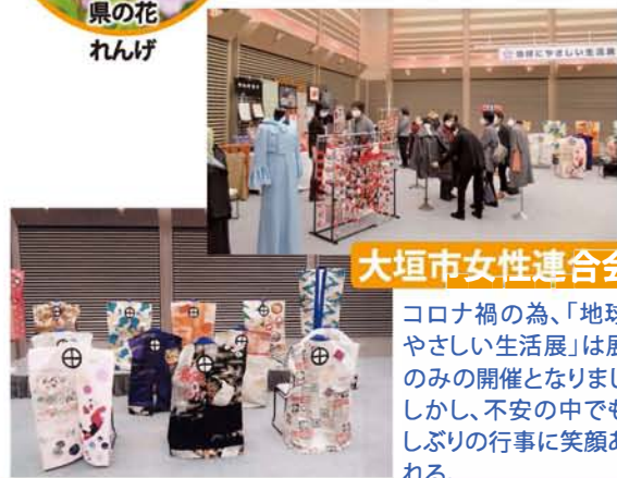
大垣市女性連合会

コロナ禍の為、「地球にやさしい生活展」は展示のみの開催となりました。しかし、不安の中でも久しぶりの行事に笑顔あふれる。