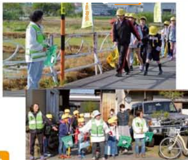
岐阜市柳津女性の会

コロナ禍の為、「地球にやさしい生活展」は展示のみの開催となりました。しかし、不安の中でも久しぶりの行事に笑顔あふれる。