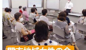
関市地域女性の会