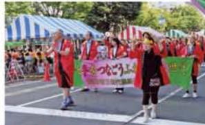
◀まつり 県内各市町において春・夏・秋・冬と“まつり”が実施されています。福井市三世代連絡運営委員会(婦人会・壮年会・老人会・青年団)として民謡の部に参加。