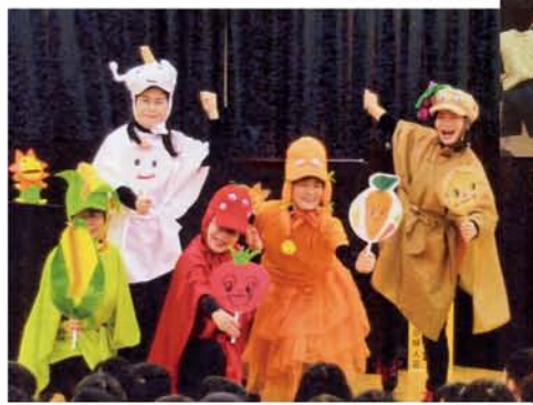
▲「おいしくふくい食べきり運動」 保育園での学習会「たべるんジャー!!私達は5連ジャーです」(スイートコーン・にんにく・とまと・きょうろふく・玉ねぎ)

福井県連合婦人會として、福井県「ふくいSDGsパートナー」に登録をいたしました。1つ目には、全世界で大きく取り上げられている“食品ロス削減”を尚一層、啓発・促進して行くこと。2つ目には、未来ある青少年の育成に力を注ぐこと。私たちはこの2点に焦点を当て、持続可能な社会の形成に力を尽くして活動を続けていきます。