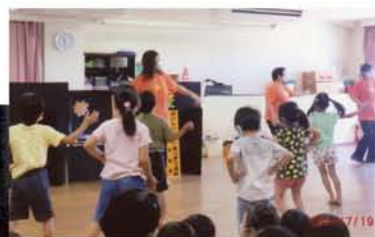
▲保育園での学習会 食べきりダンスを一緒に!!