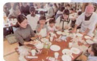
◀和食文化と行事食の伝承