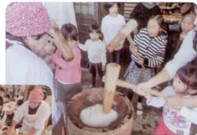
◀▲伝統を伝える 楽しさも伝える