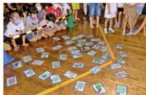
▲児童館(小学1年～3年) 環境カルタ取り