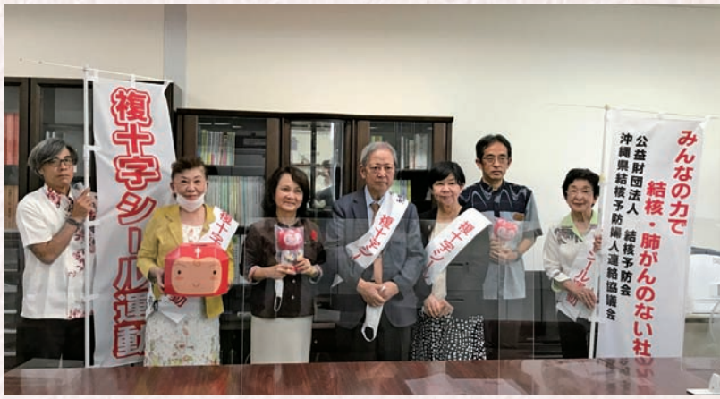
沖縄県結核予防婦人連絡協議会が沖縄県知事表敬訪問を実施 令和3年10月27日

(1面の続き) また、昭和24年以来毎年開催されている「結核予防全国大会」に各地の女性団体をメインに毎回千名ほどで参加し、開催地の都道府県民をはじめ全国民の結核予防に対する関心を高め、結核予防活動の具体的な進め方や当面する結核に関する諸問題を検討してきた。 昭和25(1950)年の結核死亡者数は約12万人。平成30(2018)年は約2千人(厚生労働省平成30年結核登録者情報調査年報集計結果より)で確実に減少傾向にある。女性団体の継続的な活動に加え、医学の進歩、衛生的な生活、栄養豊富な食事等様々な要因が総合的に作用しての結果と言える。 WHO(世界保健機関)は2030年までに世界から結核を根絶することを目標に掲げている。ここまで結核犠牲者を減らせたのなら、根絶まではあとわずか。世界に先駆けて日本が結核根絶を宣言できるよう、会員の皆様には継続的な活動をお願いしたい。