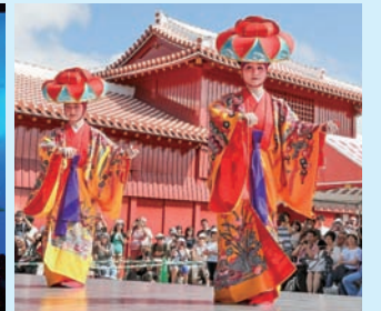
▲美ら海水族館では、神秘に満ちた沖縄の生き物たちの雄大な世界が広がります(写真左)。琉球舞踊は琉球王国時代から伝わる格式ある舞踊で、平成22年9月に国の重要無形文化財に指定された日本を代表する芸能です(写真右)。