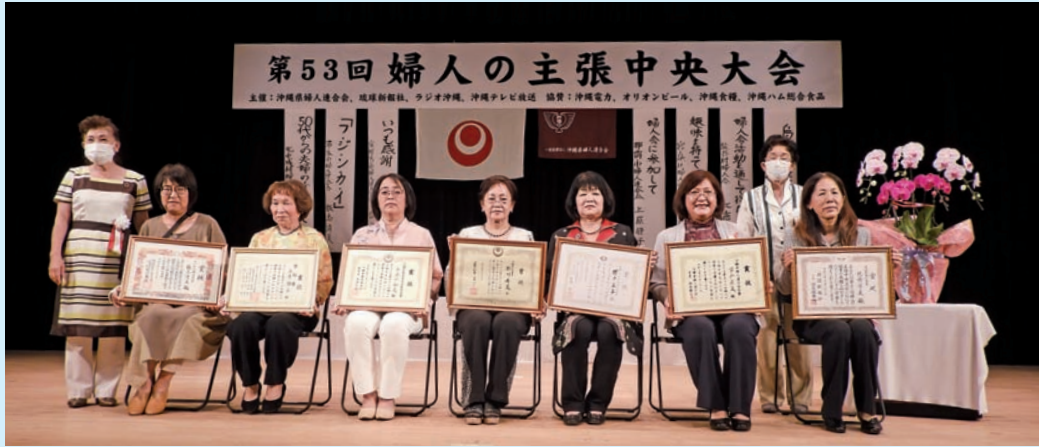
▲近い未来、全国大会が開催されることを願い10月22日に「婦人の主張中央大会」を開催しました。