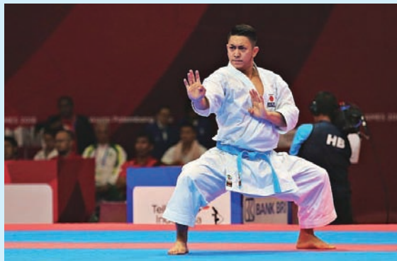
▲東京オリンピックで初めて行われた空手において、仮定の敵を想定した攻防を演じる「型」で金メダルを獲得した喜友名諒氏は、日本中に大きな感動と喜びをもたらしてくれました。