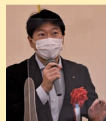
▲来賓祝辞 岡山県知事 伊原木 隆太 氏