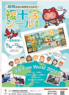
「複十字シール募金」は結核や肺がんなどの胸の病気の予防啓発、対策支援、調査研究等に活用されている

戦前は紡績工場で働く女工などに犠牲者が多く出ており、戦中は徴兵される中心に結核が蔓延した。いずれも長時間労働による過労、栄養不足や集団生活が大きな原因となっていた。戦時体制を脱した終戦3年ほどでようやく結核患者の過剰死亡は解消しつつあったが、昭和25年長野県の小学校で結核の集団感染が発生し、社会問題となった。その時、母親たちが改めて結核の恐ろしさを知り、家庭から、地域から、社会から結核を追放しようと立ち上がり、その活動が現在の女性団体の結核予防運動につながっている。