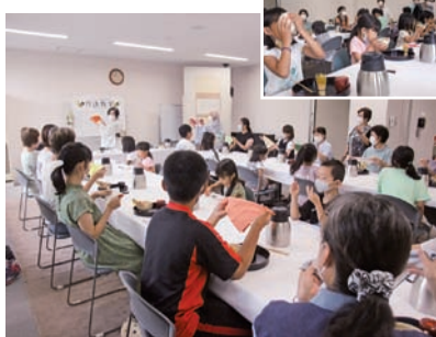
▲作法教室 茶道の作法を1から学べる教室を開催。初めに手本を学び、大人が見本を見せてから、子どもたちも茶をたてる。コロナ禍での開催のため、和室では実施せず。

子育て支援事業の一つとして、三世代交流事業に取り組んでいます。祖父母・親子の三世代が参加できるよう料理教室・作法教室・スポーツ教室等工夫し、活動しています。こどもたちからは楽しい思い出ができた、また参加したい、親世代からは、家族間・地域間の絆が深まったなど好評を得ています。地域の皆さんと共にふれあい、交流を大切に安全安心な地域づくりに貢献できたらと思います。