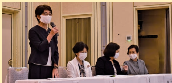
▲各県代表者一言メッセージ