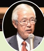
▲特別講演(II) コロナ後の社会を考えてみる 長崎大学 学長 河野 茂氏