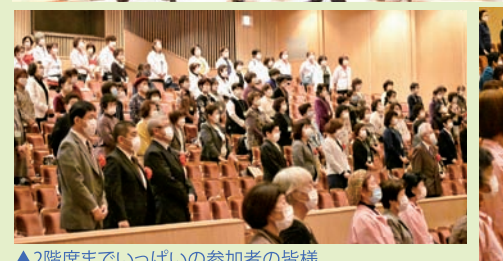
▲2階席までいっぱい参加者の皆様