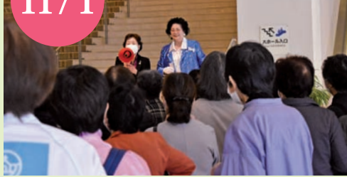
▲朝早くから集まったスタッフたちは、長崎県西山会長の指示のもと、てきばきと手際よく受付の準備を進めました。