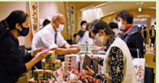
▲会場エントラ ンスでは地元長崎の 名産品が勢揃いし、 全国から訪れた皆 様の目を楽しませ ていました。