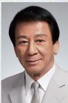
記念コンサートプロデューサー 杉良太郎 新生・ 全国女性会と共に

このたびは、創立70周年、誠におめでとうございます。 私は名誉税関長を務めていた1990年頃に「女性の活躍する場所」「女性の職員・社員を増やしたい」という運動をしておりました。横浜税関はいち早く、それを取り入れてくださり、その後男性ばかりだった職場に大きな変化が現れました。 そもそも、長年、海外でも活動をする中で、日本の女性は活躍できていないということは、身に染みてわかつていくことでした。女性の優れた能力を存分に発揮する場所があつてしかるべきはずなのにそれが整えられていないことはもったいないと思い、訴え続けてきたのです。