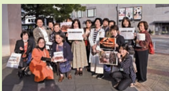
▲1日目、2日目とも晴天に恵まれ、会場のあちこちで記念撮影や募金活動などの交流に花が咲きました。