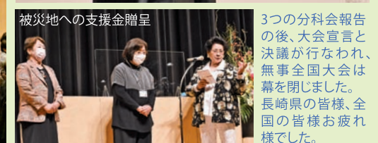
被災地への支援金贈呈 3つの分科会報告の後、大会宣言と決議が行われ、無事全国大会は幕を閉じました。長崎県の皆様、全国の皆様お疲れ様でした。