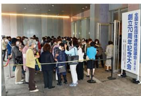
会場前には長蛇の列ができ、皆さん開場を心待ちにしていました。