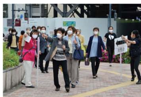
会場近くではスタッフが道案内・安全確保をして来場者をおもてなし。