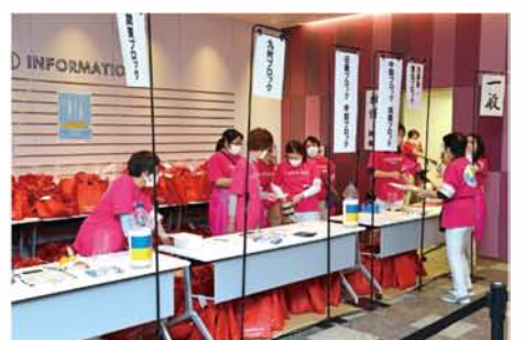
会場は朝7時からスタッフが準備に大わらわでした。