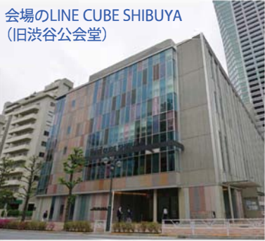
会場のLINE CUBE SHIBUYA (旧渋谷公会堂)

編集・発行 全国女性団体連絡協議会 〒150-0002 東京都渋谷区渋谷1-17-14 電話 03-3407-4303(代) http://www.chifuren.gr.jp 共催:全国女性会館