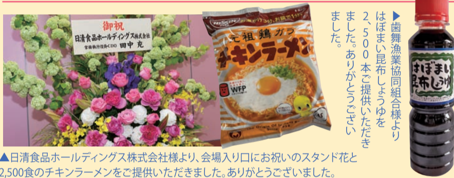
▲日清食品ホールディングス株式会社様より、会場入り口にお祝いのスタンド花と2,500食のチキンラーメンをご提供いただきました。ありがとうございました。

▲デリバリーステーションは、誰でも簡単にできる自動炊き上げ炊飯機能付きで、炊飯器の内釜はお手入れ簡単なフッ素加工。コンロは煮こぼれなどで火が消えた時の立ち消え安全機能を搭載。収納時も場所を取らない省スペース設計で、キャスター付きなので移動にも便利な優れものです。