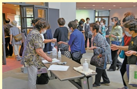
コロナ対策として消毒の徹底と、入場人数を制限しての開催となりました

ここ数年のうちに「新型コロナウイルス感染症」は地球のあらゆる地域に蔓延し、人々の生命を脅かし生活様式の厳しい規制も余儀なくされた。その結果、経済活動から人々の身体的、精神的な面まで、計り知れないほどの多くの影響を受けたと言われている。長く人々を苦しめる「新型コロナウイルス感染症」についてしっかりと学び、このような状況下でも意義深き生活や活動ができるよう研修することをねらいとする。