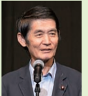
来賓祝辞 衆議院議員 今村 雅弘氏