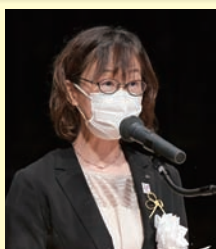
来賓祝辞 宮城県知事 村井 嘉浩 氏(代読)