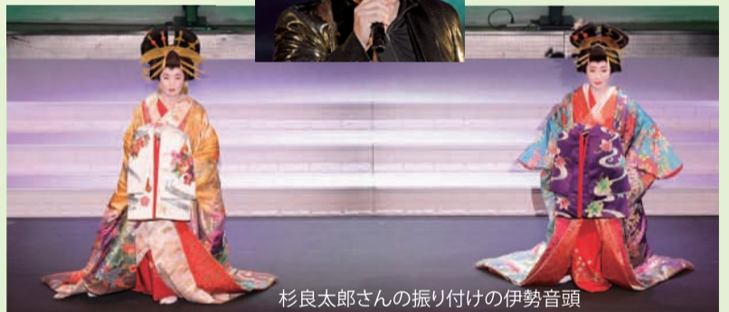
杉良太郎さんの振り付けの伊勢音頭