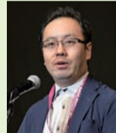
来賓祝辞 嬉野市長 村上大祐氏