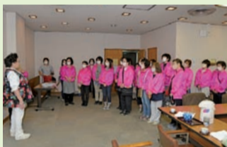
スタッフはお揃いのジャンパーで