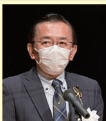
来賓祝辞 宮城県議会議長 菊地 恵一 氏