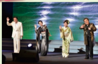
拍手が鳴り止まないフィナーレ