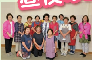
武雄市婦人会おもてなし隊の皆さん