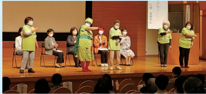
歌って踊る「もったいないの歌」は手遊びになっています