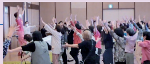
全員参加で楽しいエアロビクス