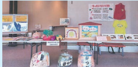
会場ロビーには食品ロス削減のための啓発グッズを展示