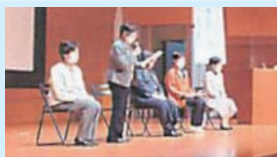
各県代表ひと言メッセージ