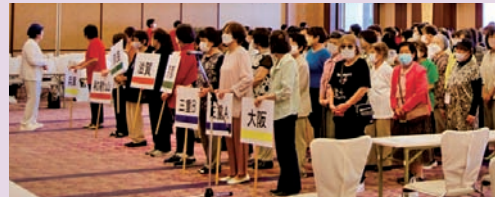
チーム対抗ゲーム(防災ゲーム)