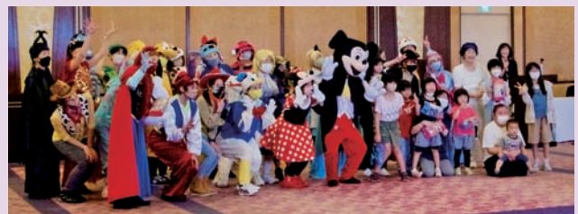
世界は一つ 三重県女性会・健康づくり隊