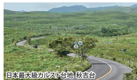
日本最大級カルスト台地 秋吉台