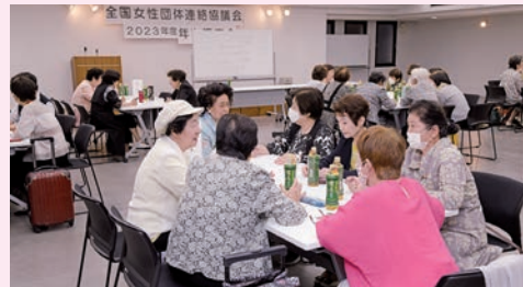
▲2日目のグループワーク