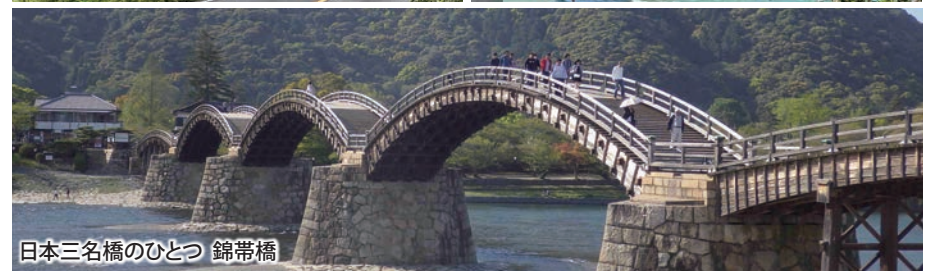
日本三名橋のひとつ 錦帯橋