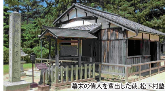
幕末の偉人を輩出した萩 松下村塾