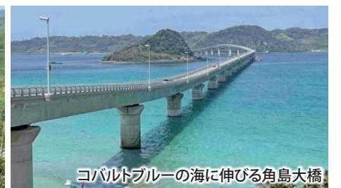
コバルトブルーの海に伸びる角島大橋