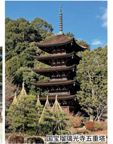
国宝瑠璃光寺五重塔