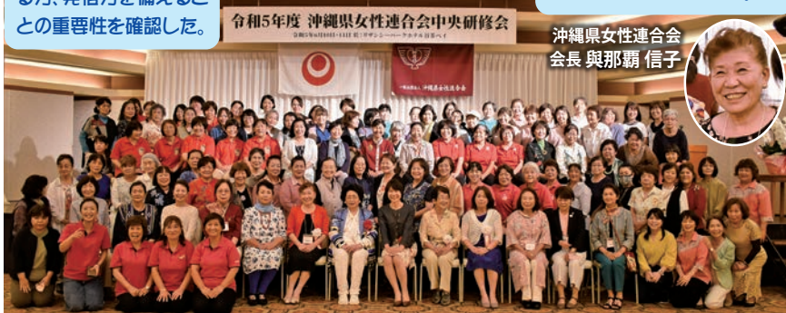
令和5年度 沖縄県女性連合会中央研修会