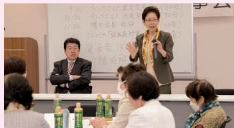
▲ミニセミナー「認知症対策(金融リスク)」 認知症は発症してしまつたら戻れないが予防はできる。認知症になると預金は凍結され、契約行為はできなくなるので事前に対策しておくことが大切。

5月30日(火)、31日(水)の2日間にわたり、渋谷商工会館消費者センター大研修室で2023年度年次理事大会を開催しました。出席39名、委任状出席9名で全員参加の中、2022年度事業報告、決算報告、2023年度事業計画、予算案などが承認されました。報告事項として2023年度研修会・講座等の開催について、2023年度活動助成金分配についてなどがありました。2日目は各ブロックに分かれてグループワークを行い、それぞれが抱える問題点や今後の展望などを検討しました。最後にミニセミナーとして(株)トライマックス代表取締役による「認知症対策(金融リスク)」の講演を聞き終りとなりました。