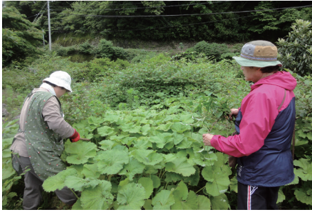
救荒植物の採取。全国的に馴染みの深い自生したフキも救荒植物です。