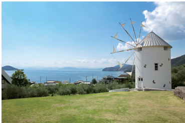
小豆島オリーブ公園

A 讃岐うどんのための県産小麦がほしい、という関係者の声にこたえて、県の農業試験場で開発されたのが「さぬきの夢」です。最初の「さぬきの夢2000」以降、今も改良が加えられ、うどん以外にも使われるようになっています。県産ブランド米「おいでまい」も農業試験場が努力して開発した新品種で、最高の評価「特A」を何度も獲得しています。