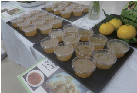
室戸岬海辺の海藻、天草(地元ではイグリスとも言う)を使って作ったところてん。