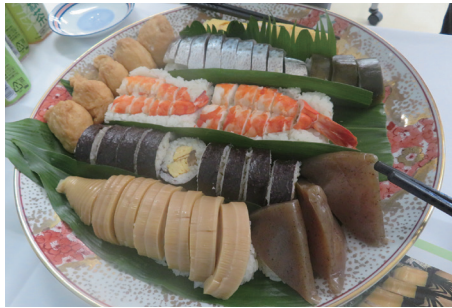
筍やコンニャクを使った田舎寿司とエビやサバなどの海産物の押し寿司の皿鉢料理。

高知県は災害が起きれば、津波・地震の被害に必ず遭います。災害が起きた時、いかに生き延びるかを婦人会が次の世代に継承していかなければなりません。その一つの方法として救荒植物を使用した郷土料理があります。救荒植物とは山や野に自生する植物で、飢饉、災害、戦争等で食べ物不足時に食料として利用される植物です。様々な救荒植物料理を一皿に盛り込んだ皿鉢料理を海外の方に試食していただきました。大変に好評でしたので、今後、室戸ユネスコ世界遺産ジオパークを訪れるお客様に、こうした郷土料理を知っていただく機会を増やしたいと思います。また、中学生や高校生に地元郷土料理を伝える活動や、ジオサイトの清掃活動は今後も継続してまいります。