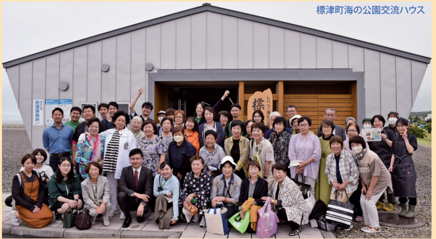
標津町の公園交流ハウス

盛りだくさんな内容で充実した三日間でしたが、ロシアによるウクライナ侵攻、コロナの流行など様々な問題はあれ、私たちは北方領土問題解決を目指して今後も国民運動を推進していくことを再確認した交流会でした。