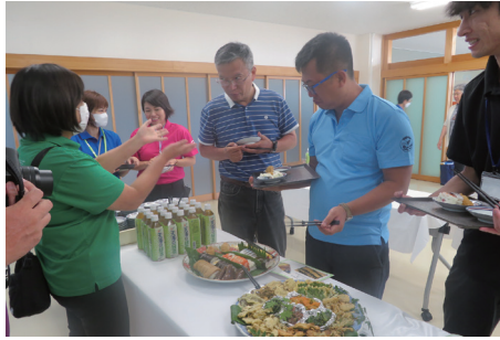
通訳を交えながらイグリス羊羹と救荒植物の天ぷらや和え物の試食。