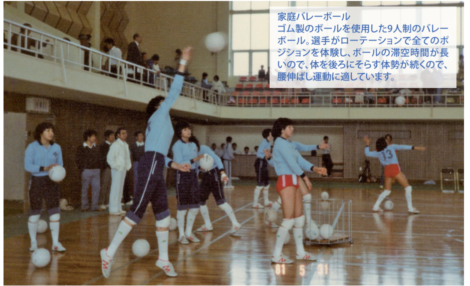
家庭バレーボール ゴム製のボールを使用した9人制のバレーボール。選手がローテーションで全てのポジションを体験し、ボールの滞空時間が長いので、体を後ろにそらす体勢が続くので、腰伸ばし運動に適しています。

昭和40年5月に郡山市と安積郡9か町村および田村郡1町が、さらに8月には田村郡2村が対等合併し新郡山市が誕生しました。それと時期を同じくして郡山市婦人団体協議会も生まれました。市町村合併を機に体力づくりの指定都市に選定された郡山市では、日頃スポーツの機会に恵まれない人のため、だれにでも簡単にどこでもできるスポーツを検討していました。前年の東京オリンピックの女子バレーボールチームの活躍に刺激を受け、バレーボール熱が高まっていたこともあり「家庭バレーボール」の普及を図りました。この家庭バレーボールは、一年中農繁期という農家の女性が野良着のまま空き時間にできること、前かがみの体勢が多い農作業の合間の腰伸ばし運動として適していること、何よりスポーツは人の和、交友関係が深まり楽しいことから、瞬間に地域に広がりました。昭和41年7月に第1回家庭バレーボール郡山市親善大会が開かれると、地域の多くの女性が参加しました。昭和50年の10回大会までは毎年継続開催され、それ以降は4年に1回の開催となりましたが、重要なスポーツレクリエーションとして、現在もしっかりと地域に根付いています。