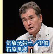
気象予報士 俳優 石原良純