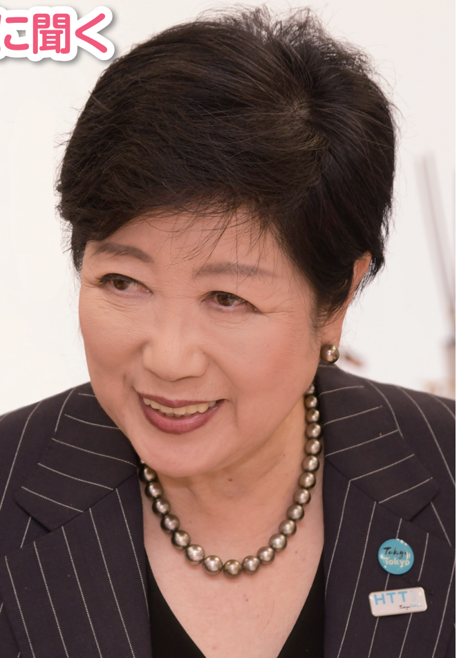
東京都知事 小池百合子 こいけ ゆりこ 1952年兵庫県生まれ。カイロ大学文学部社会学科卒業。1992年参議院議員、翌年には衆議院議員に。環境大臣、内閣府特命担当大臣、内閣総理大臣補佐官、防衛大臣などを歴任。2016年7月東京都知事初当選。現在2期目。