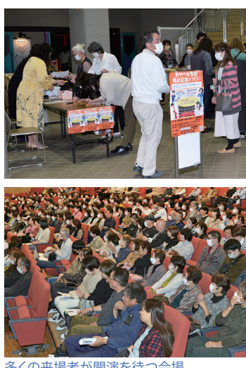
多くの来場者が開演を待つ会場