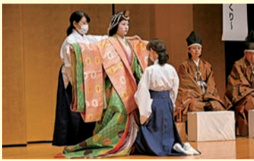
オープニング:下鴨神社による十二単衣の着付けと王朝舞