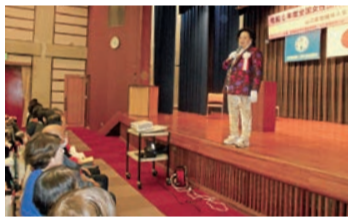
櫻井会長のメッセージ

10月21日(月)、22日(火)の二日間、山口県婦人教育文化会館にて、中国5県の会員約400名の参加で開催されました。開会行事では県知事様、市長様のご祝辞のあと、全女会櫻井会長の「次世代へ繋いでいく」という力強いメッセージを受け取りました。