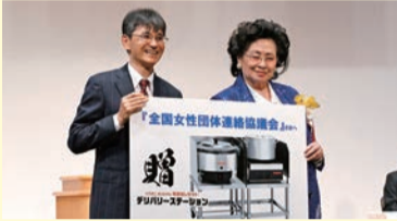
日本LPガス団体協議会様より デリバリーステーションを寄贈頂きました