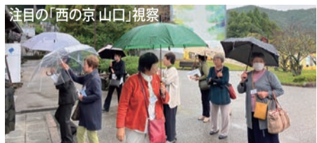
注目の「西の京山口」視察

2日目は、ニューヨークタイムズ紙で「2024年に行くべき52か所の3番目に選ばれた山口市」の瑠璃光寺、雪舟庭を訪ねました。雨に見舞われましたが、有意義な時間を過ごせました。