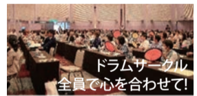
ドラムサークル 全員で心を合わせて!