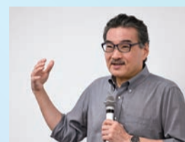
10月19日(土)2時限 睡眠研究機構教授 柳沢 正史