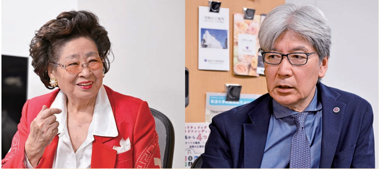
(2026年4月7日 筑波大学附属病院 院長室にて)